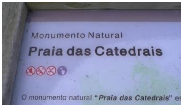
Monumento Natural Playa de las Catedrales