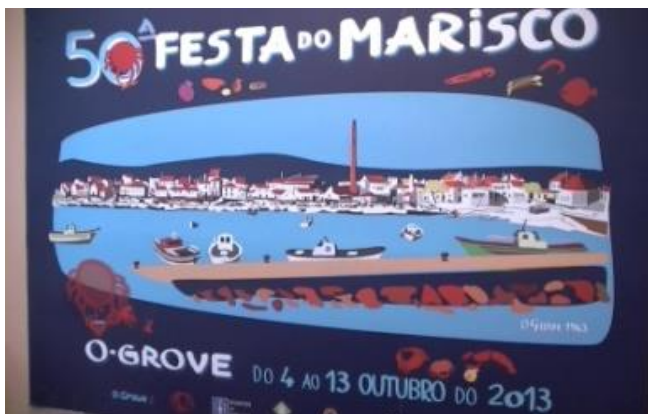
50ª fiesta del marisco O Grove Del 4 al 13 de octubre de 2013

La lengua gallega ha derivado del latín, como el español, portugués, francés, italiano o catalán.