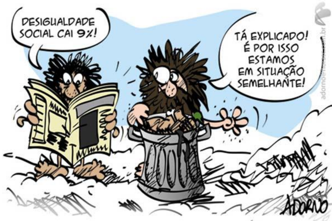
Figura 1– Charge relatando as desigualdades.

Os países “pobres” do globo são aqueles que possuem muitas desigualdades sociais e base essencialmente agrícola, por isso esses países estão entre os que não conseguem crescer e alavancar o desenvolvimento de suas nações. Cite alguns aspectos que distinguem esses países dos países desenvolvidos. (4 ou mais características).